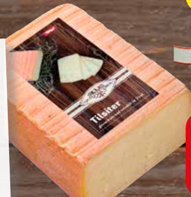
„Qualität Tirol“ Tilsiter ca. 32 % Fett absolut, in Bedienung

Rund 250 Bauern beliefern täglich die Zillertaler Heumilchsennerei mit gentechnikfreier Heumilch. Die frische Milch ist die ideale Grundlage für köstliche Käse-Spezialitäten. Der Tilsiter verfügt über ein feines, g'schmackig-mildes Aroma und passt perfekt zum Frühstück und zur Brettljause.