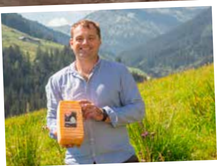
Zillertaler Heumilch Sennerei, Fügen

Rund 250 Bauern beliefern täglich die Zillertaler Heumilchsennerei mit gentechnikfreier Heumilch. Die frische Milch ist die ideale Grundlage für köstliche Käse-Spezialitäten. Der Tilsiter verfügt über ein feines, g'schmackig-mildes Aroma und passt perfekt zum Frühstück und zur Brettljause.