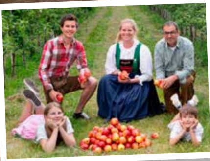
Oberinntalobst, Obstlager Haiming

Der Apfelanbau hat in Tirol Tradition, denn das Klima bietet dafür optimale Bedingungen. 25 Bauern aus der Obstbauregion Oberinntal und aus Osttirol beliefern das Obstlager in Haiming mit einer beachtlichen Sortenvielfalt. Der „Qualität Tirol“ Apfelsaft wird im Obstlager Haiming gepresst und abgefüllt.