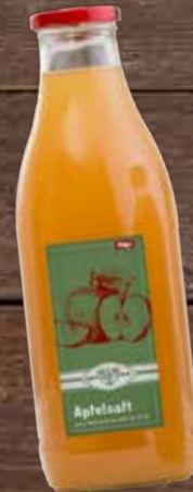
„Qualität Tirol“ Apfelsaft 1 Liter

Der Apfelanbau hat in Tirol Tradition, denn das Klima bietet dafür optimale Bedingungen. 25 Bauern aus der Obstbauregion Oberinntal und aus Osttirol beliefern das Obstlager in Haiming mit einer beachtlichen Sortenvielfalt. Der „Qualität Tirol“ Apfelsaft wird im Obstlager Haiming gepresst und abgefüllt.