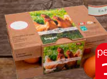
„Qualität Tirol“ Goggei aus Freilandhaltung, Gr. M, 6er