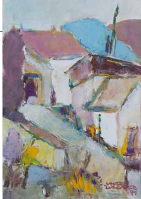
Michael Unterluggauer: Öl auf Holz - Toskana