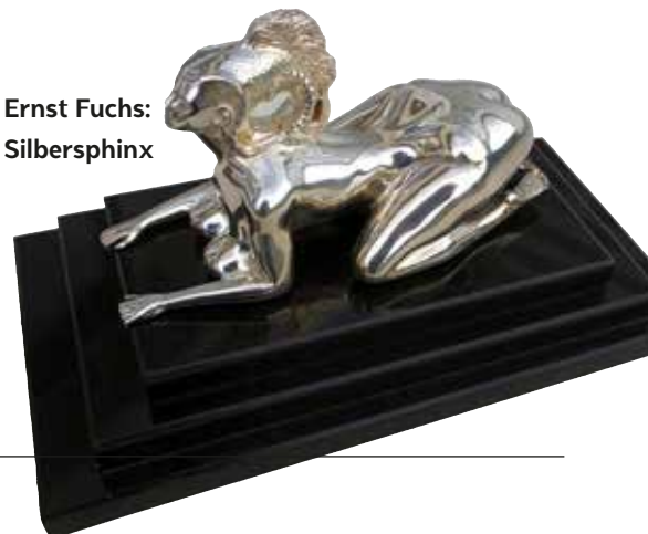
Ernst Fuchs: Silbersphinx

☉ Die Ausstellung ist bis auf weiteres während der Geschäftszeiten geöffnet.