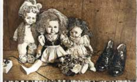
Elmar Peintner – Radierung