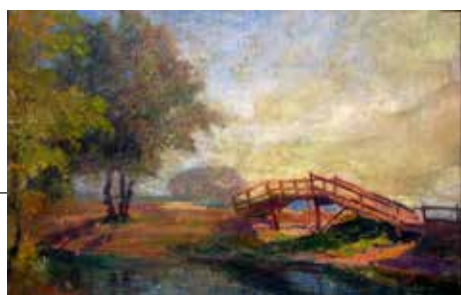
Siegfried Stoitzner – Öl auf Leinwand

☉ Die Kunstausstellung ist während der Geschäftszeiten einsehbar.